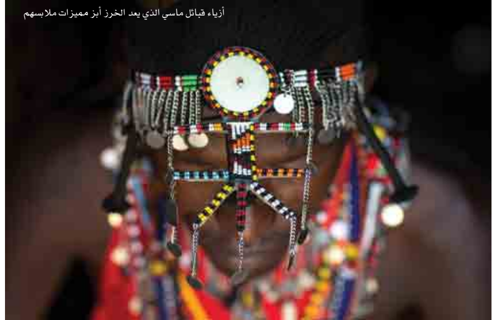
أزياء قبائل ماسي الذي يعد الخرز أبرز مميزات ملابسهم

■ أزياء شعوب نيهانغ: تشتهر شعوب نيهانغ بالطريقة التي يلف بها الرجال قوسهم بالمال، وقد سجل أحدهم رقماً قياسياً بلغ طوله 400 متر، وتطلب أكثر من مائة بيوس لتثبيتته، و 50 قطعة معدنية تحمل رموزاً دينية وبدا هذا باستخدام قماش الزي لدى طائفة الشيخ خلال معاركهم مع الغول، لحماية الرأس من الضربات خلال القتال، ثم