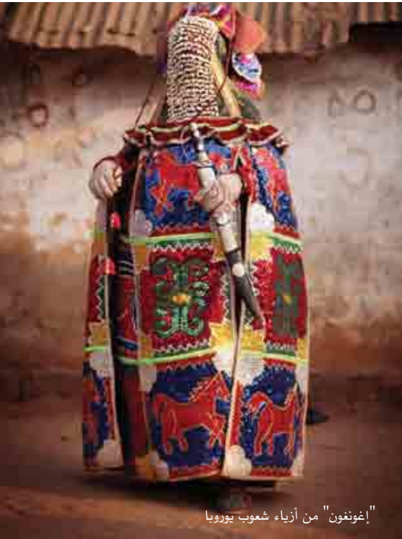
"إغونغون" من أزياء شعوب أوروبا